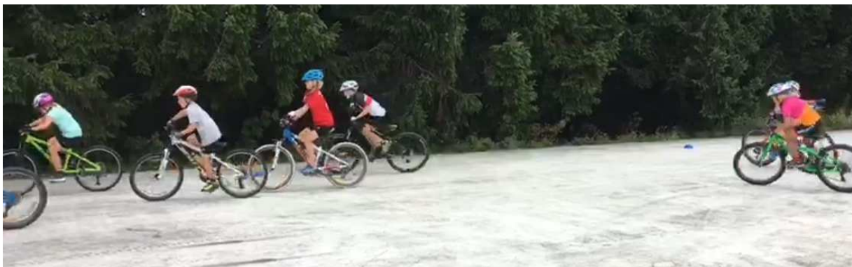
Ein Bild vom Sprinttraining in Bernau

Ansonsten ist aufgrund der Ferien und dem Priener Fette Reifen Rennen wenig vom Training zu berichten